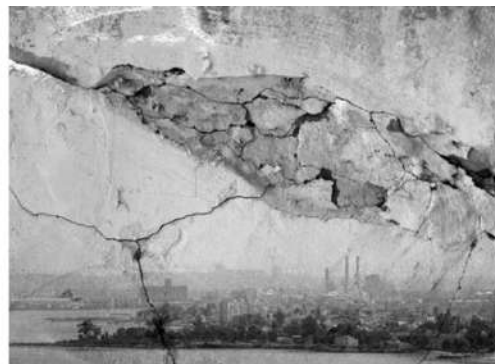
Log: Fisuras de resolución - right side. / Doc: Fisuras de resolución - left side.

Me importa mucho lo que sucede hoy pero en relación al pasado. Es como conciliar mundos distintos. Me enfoca en las perspectivas de la mirada: qué vemos y desde dónde. Empecé a trabajar con drones para distorsionar las perspectivas de la mirada humana. La impresión de los que viven en Chile no es la misma que la de los de afuera; los que están arriba, no ven lo mismo que los de abajo; y los que tienen los ojos cerrados, no ven lo mismo que los que los tienen abiertos. ¿Qué pasa si distorsionamos la perspectivas de la mirada?